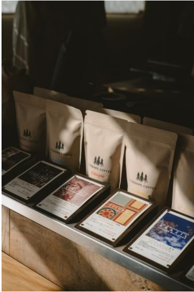
3 CEDARS COFFEE(大分) コーヒー

大分県大分市に現在2店舗を構えるコーヒーロースターです。導入当初から改良を重ねている焙煎機で焙煎し、新鮮なコーヒー豆をお客さまに提供しています。