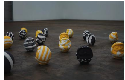
藍森山(福岡) 草木染めだるまワークショップ

い草のこれから、い草をこれから。熊本県八代市の畳の原料、い草を”身につける”という視点で再構成し、軽やかで柔らかな香りを纏うジュエリーを制作しています。