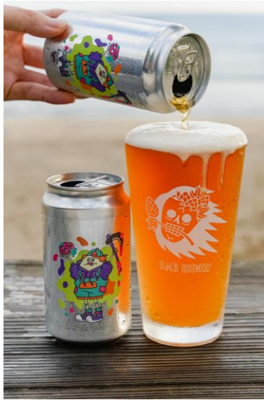
B.M.B Brewery(宮崎) クラフトビール

鹿児島市上谷口町の総合運動公園内にあるgallery & collective store。店主が大事だと思う、現代アートから骨董品まで好きな匂いのする物を集めて販売しております。