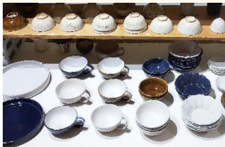
初登場！ カモイケ工房（鹿児島市）