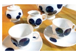
初登場！ Antico y（鹿児島市）