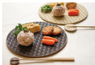
初登場！ 真窯 MAKOTO Kiln（鹿児島市）