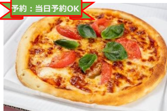
AMUWE2F トラットリア葡萄の樹 ピッツァマルゲリータ ¥951