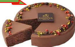
本館1F GODIVA クリスマス ガトー オ ショコラ ¥4,482