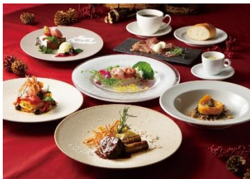
本館5F TANTO TANTO クリスマスコース ¥13,200 黒毛和牛フィレ肉とフォアグラをメインに、 前菜2品・リゾット・パスタ・デザートまで 堪能できる豪華コース

提供期間：12/23～12/25 当日予約可 ※但し予約状況による ※2名様からのご予約