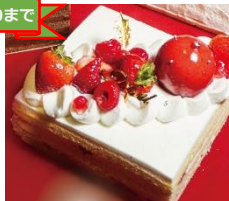
本館B1F soak 純生デコレーション ¥3,300（4号）