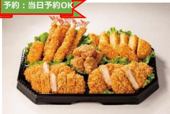
本館B1F とんかつ新宿さぼてん ウィンターオードブル ¥5,100