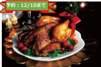
本館5F うまや みつせ鶏 秋鶏ローストチキン ¥5,000