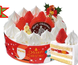
AMUWE1F 山形屋ストア ヤマザキ生ケーキ ¥2,916（5号）